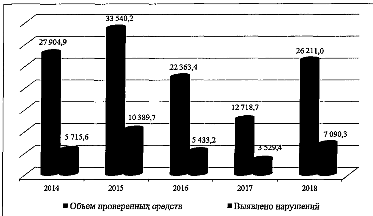
Рис. 1 Динамика основных показателей деятельности КСП, млн. рублей.

Динамика показателей по объему проверенных средств и выявленных нарушений бюджетного законодательства за период 2014 – 2018 годов представлена на рис. 1.