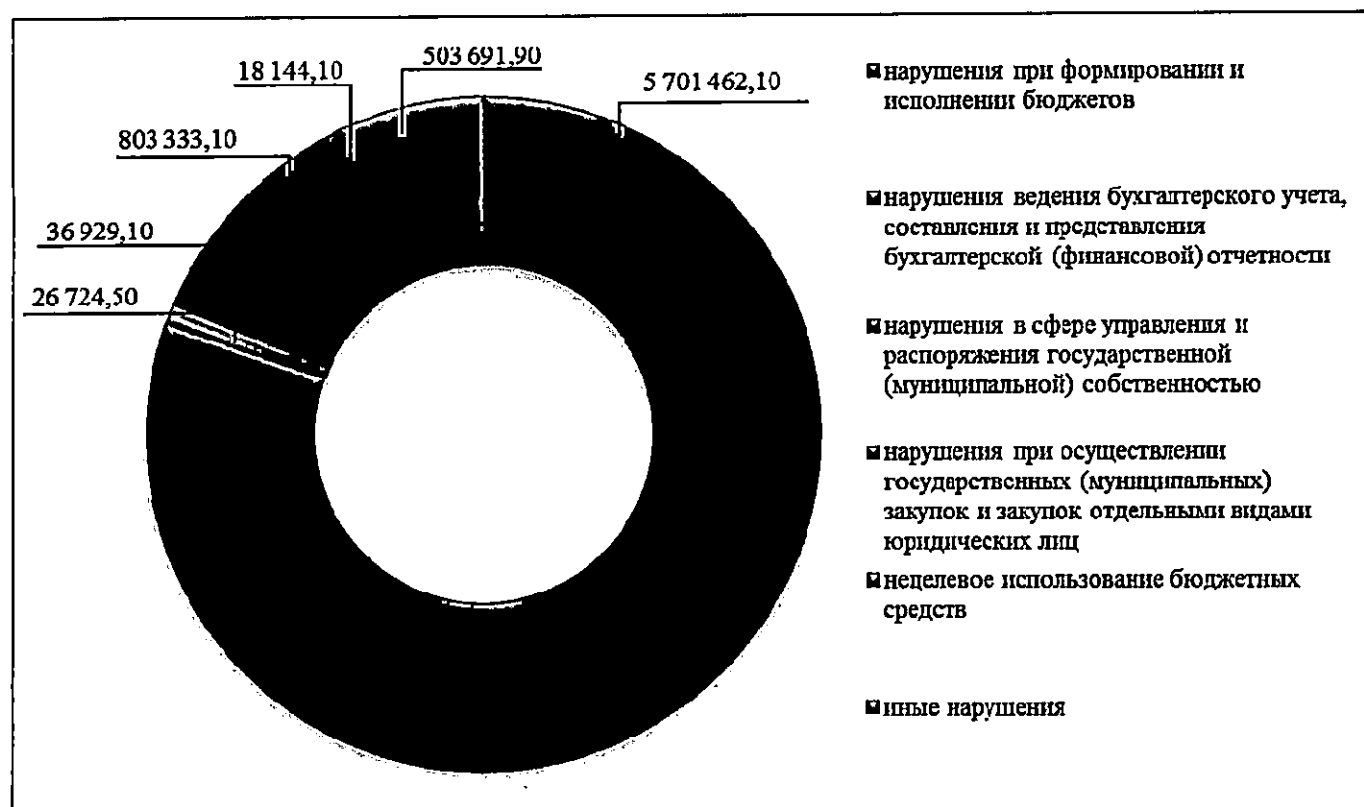
Рис. 2 Нарушения, выявленные в 2018 году, тыс. рублей

Доля каждого вида нарушений в общем объеме выявленных в 2018 году нарушений при осуществлении внешнего государственного финансового контроля представлена на рис. 2.