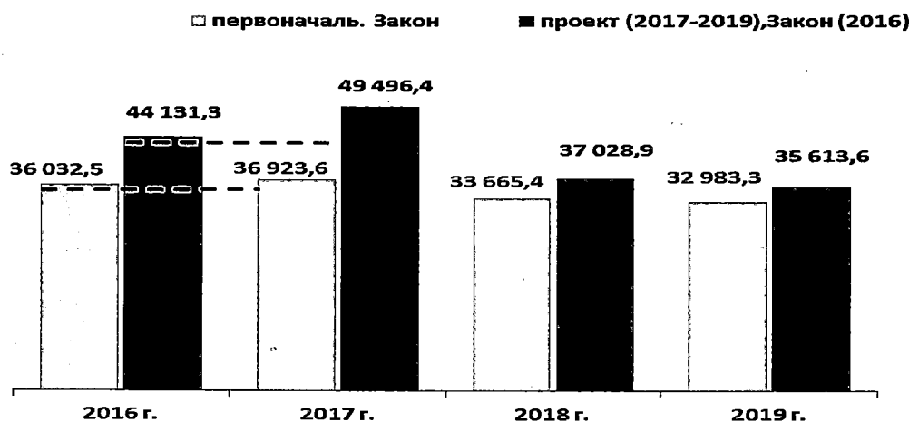
Рис. Изменения объемов межбюджетных трансфертов муниципальным образованиям Иркутской области, млн. рублей