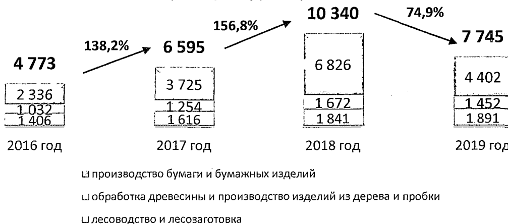
Структура налоговых платежей в консолидированный бюджет Иркутской области предприятий лесопромышленного комплекса (млн рублей)

С учетом непосредственно связанных с лесозаготовительной деятельностью неналоговых платежей за использование лесов вклад предприятий лесной отрасли оценивается по итогам 2019 года в размере 9,6 млрд рублей, с ростом к уровню 2016 года на 4,2 млрд рублей или в 1,8 раз.