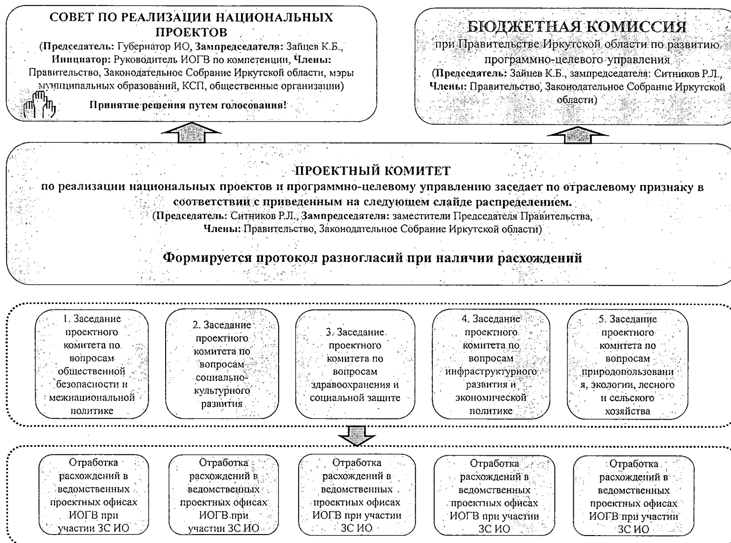
СХЕМА ВЗАИМОДЕЙСТВИЯ ПО МОНИТОРИНГУ И КОНТРОЛЮ РЕАЛИЗАЦИИ НАЦИОНАЛЬНЫХ ПРОЕКТОВ И ГОСУДАРСТВЕННЫХ ПРОГРАММ ИРКУТСКОЙ ОБЛАСТИ