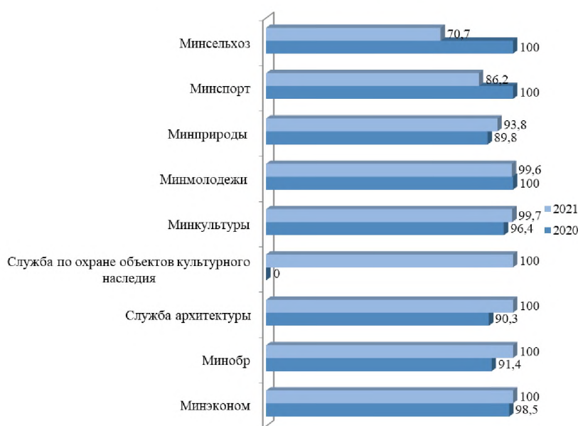
Диаграмма. Сравнительная оценка эффективности предоставления субсидий МБ в 2020-2021 годах

Сравнительная оценка в 2020-2021 годах в разрезе ГРБС представлена в диаграмме (в части ГРБС, по которым оценка за исследуемый период различная).