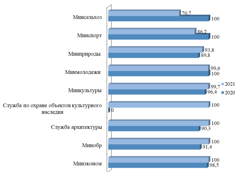
Диаграмма. Сравнительная оценка эффективности предоставления субсидий МБ в 2020-2021 годах

Сравнительная оценка в 2020-2021 годах в разрезе ГРБС представлена в диаграмме (в части ГРБС, по которым оценка за исследуемый период различная).