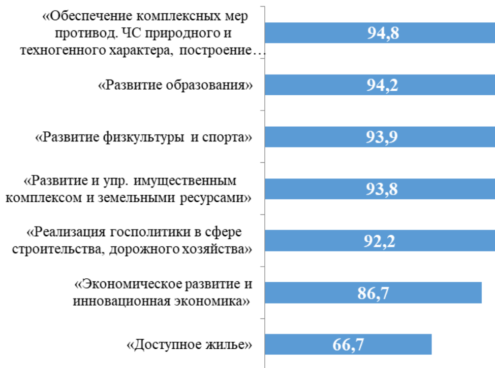
Диаграмма. Госпрограммы, уровень исполнения которых составляет менее 95%.

Низкий уровень исполнения отмечается по ГП «Обеспечение комплексных мер противодействия чрезвычайным ситуациям природного и техногенного характера, построение и развитие аппаратно-программного комплекса «Безопасный город» - 94,8%, «Развитие образования» - 94,2%, «Развитие физкультуры и спорта» - 93,9%, «Развитие и управление имуществом комплексом и земельными ресурсами Иркутской области» - 93,8%, «Реализация государственной политики в сфере строительства, дорожного хозяйства» - 92,2%, «Экономическое развитие и инновационная экономика» - 86,7%, «Доступное жилье» - 66,7%, представленным на следующей диаграмме.