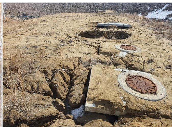
ЛОС ГТС г. Тулун

Исполнительным органом государственной власти Иркутской области, осуществляющим функции по управлению в области охраны окружающей среды, недропользования, водных отношений, обеспечения безопасности гидротехнических сооружений является министерство природных ресурсов и экологии Иркутской области (далее - Минприроды). Подведомственное Минприроды ОГКУ «Дирекция по эксплуатации гидротехнических сооружений и ликвидации экологического ущерба» (далее – Дирекция по эксплуатации ГТС) согласно Уставу выполняет функции заказчика при обеспечении сохранности и безопасности гидротехнических сооружений.