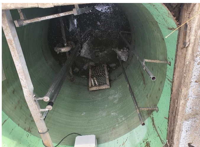
ЛОС ГТС г. Нижнеудинск

Фактическое назначение построенных ЛОС заключается в перекачке (отводе) очищенных сточных (ливневых) вод через ГТС в реку, когда их отведение самотеком невозможно. Более того, из-за строительства ГТС традиционный отвод данных сточных (ливневых) вод самотеком в реку и становится невозможным. Подобные ЛОС имеются в составе автомобильных дорог, улично-дорожной сети, мостов, мостовых переходах и образуют с ними единые объекты. Данные ЛОС не имеют отношения к очистным сооружениям жилищно-коммунального хозяйства, имеющим совершенно другое назначение – очистку неочищенных коммунальных хозяйственно-бытовых и промышленных вод.