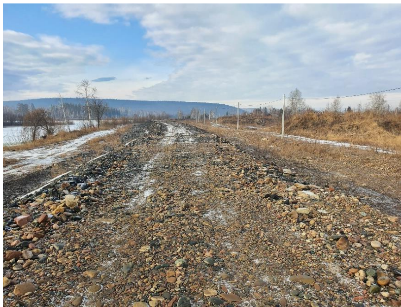
ГТС г. Нижнеудинск

ГТС были введены в эксплуатацию на основании разрешений на ввод объектов в эксплуатацию 23 . Поскольку ГТС предназначены для защиты жизни и здоровья граждан, отсутствие текущих работ по их эксплуатации негативно сказывается на их техническом состоянии. При этом ОГКУ «ЕЗИО» проводить работы по текущему содержанию сооружений не имеет полномочий, а также финансовых ресурсов.