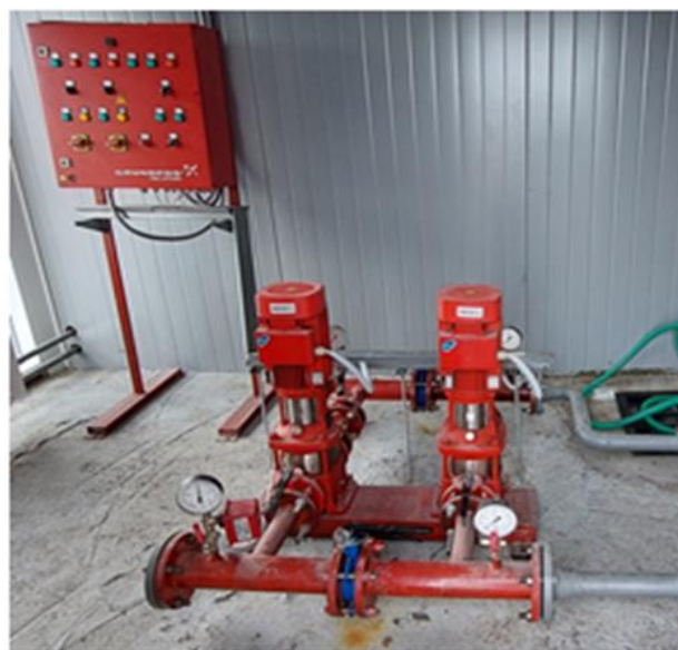
Установка пожаротушения не соответствует проекту, с худшими характеристиками

Установлено некачественное выполнение отдельных видов работ (акт осмотра от 18.24.2024) на общую сумму 2 628,9 тыс. р. Так, укладка спортивного