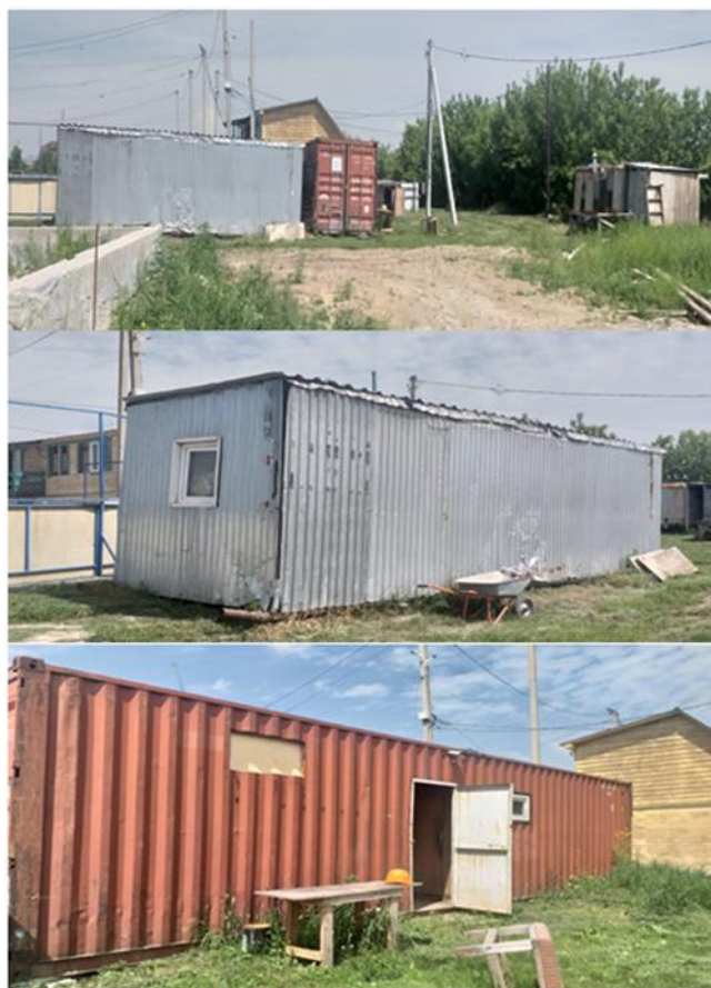
Бытовки на строительной площадке ФОК д. Карлук 21.06.2022

По акту о приемке выполненных работ ф. КС-2 от 10.10.2023 № 13 администрацией Карлукского МО приняты затраты на временные здания и сооружения (аренда строительного вагончика-бытовки) в сумме 2 622,7 тыс. р. при отсутствии достаточных оснований. Так, для подтверждения фактических затрат на временные здания и сооружения подрядчиком представлен договор аренды от 08.06.2020, заключенный между ООО «СибСтальСтрой» и ООО «Иркутская транспортная компания» на аренду временных зданий и сооружений (3 бытовки, площадью 15 м 2 каждая), в котором кроме указания площади бытовок отсутствуют другие данные, позволяющие идентифицировать имущество, передаваемое арендатору (марка, модель, цвет, идентификационный, заводской, серийный номер, размер, год изготовления), и акт от 10.07.2023, подписанный сторонами договора, в котором указана арендная плата за 36 мес. в сумме 4 320 тыс. р. При этом согласно выписке из ЕГРЮЛ у ООО «Иркутская