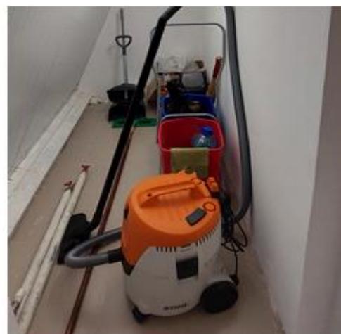
душевой поддон в комнате уборочного инвентаря отсутствует

- в комнате для уборочного инвентаря (помещение 20) не смонтированы (отсутствуют) поддон душевой, смеситель, а также не предусмотрены для их подключения трубы горячего и холодного водоснабжения, канализации. Между тем, работы по их установке (включая стоимость материалов) подрядчиком предъявлены по актам ф. КС-2 от 20.06.2023, от 19.05.2023, от 06.09.2023, а заказчиком приняты и оплачены (п/п от 24.05.2023, от 07.07.2023, от 19.09.2023);