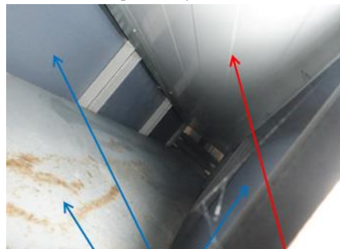
Внутри короба, которым обшиты металлические колонны ФОК (колонна, гипсокартон, сэндвич-панель)

- огнезащитная обработка металлических балок и стоек, предусмотренная проектными решениями (лист 3 раздела РД «Архитектурные решения») в виде их обшивки двойным слоем гипсокартона «Кнауф Файерборд» со всех 4-х сторон стойки (балки), фактически выполнена только с 3-х сторон, с 4-ой стороны примыкают стеновые сэндвич-панели. Исходя из этого, не выполнено ¼ от общего объема работ по огнезащите. При этом указанные работы по акту ф. КС-2 от 19.05.2023 подрядчиком предъявлены, а заказчиком приняты и оплачены в полном объеме, предусмотренном проектом (п/п от 24.05.2023);