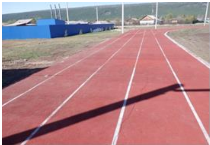
Разметка спортивных дорожек, выполненная краской, после смены сезонов не исчезла

- из 15 ковриков для занятий фитнесом не поставлены (отсутствуют) 2 коврика, при этом по акту ф. КС-2 от 24.07.2023 заказчиком принято и оплачено (п/п от 31.07.2023) все 15 ковриков. Факт отсутствия 2 ковриков зафиксирован в акте осмотра от 12.04.2024, в том числе подписанным начальником отдела архитектуры и градостроительства