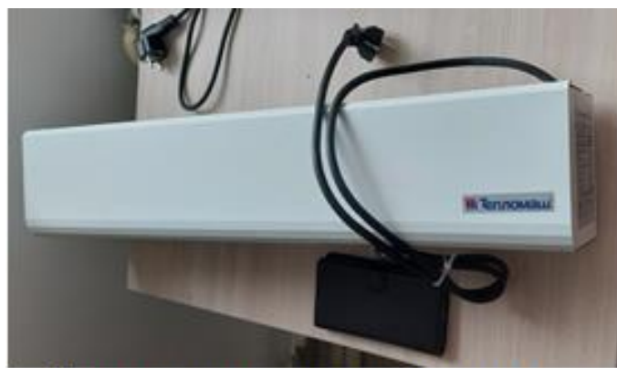
Третья тепловая завеса не смонтирована

- на системе отопления частично не смонтированы (отсутствуют) воздухоотводчики. Также из 3 тепловых завес на дату осмотра (12.04.2024) было установлено только 2 завесы Тепломаш (над главным входом и над одним из запасных выходов), еще одна завеса хранилась в тренерской. Следы монтажа над вторым запасным выходом (место ее установки) отсутствовали, что указывает на то, что работы по установке третьей завесы фактически не выполнялись. При этом, работы по установке всех 3 завес по акту ф. КС-2 от 19.05.2023 администрацией приняты и оплачены (п/п от 24.05.2023);