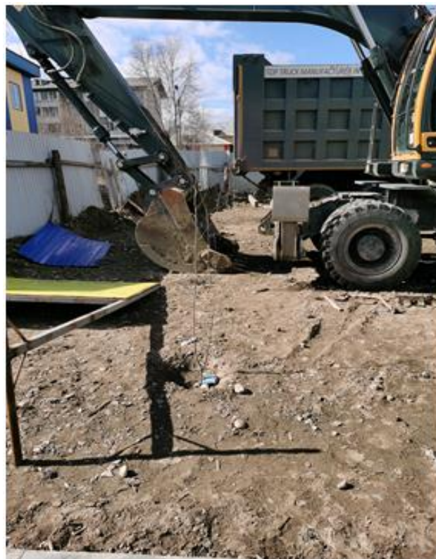
Строительная техника на участке под газон

В нарушение ч. 1 ст. 94 Федерального закона № 44-ФЗ и контракта от 02.08.2022 в ходе выполнения работ подрядной организацией (ООО «Тигран») произведена замена ряда технологического оборудования без внесения изменений в проектно-сметную документацию, являющуюся приложением к муниципальному контракту, и без пересчета его стоимости. При этом в акты о приемке выполненных работ включены комплексы строительных работ, предусмотренные сметой контракта и ведомостью объемов работ, являющихся приложением к контракту, без учета произведенной замены 231 ед. оборудования расчетно на сумму 5 306,9 тыс. р.