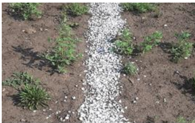
Разметка футбольного поля выполнена каменной крошкой

- работы по нанесению разметки футбольного поля краской двухкомпонентной эластичной Eurocol не выполнены. Разметка футбольного поля в нарушение правил безопасности выполнена каменной крошкой. Между тем, работы по разметке поля краской по акту ф. КС-2 от 06.09.2023 администрацией приняты и оплачены (п/п от 19.09.2023). Согласно пояснению администрации Жигаловского района, представленному в ответ на акт, в момент приемки разметка футбольного поля была выполнена краской Eurocol, как и предусмотрено проектом; вследствие эксплуатации, смены сезонов (прошло 9 месяцев) и осадков краска сошла; разметка другим составом произведена позднее по решению руководителя ФОК (МКУ ДО ДЮСШ «СИЛА СИБИРИ»). Данное пояснение КСП не принято, поскольку этой же краской Eurocol, согласно акту освидетельствования скрытых работ от 24.08.2023 № ГП-12, выполнена разметка прорезиненного покрытия спортивных дорожек, расположенных вокруг футбольного поля. Как показал осмотр спортивных дорожек (акт осмотра от 12.04.2024), их разметка после смены сезонов не сошла и под влиянием аномальных морозов и осадков не исчезла. Данный факт свидетельствует о том, что разметка футбольного поля краской не выполнялась;