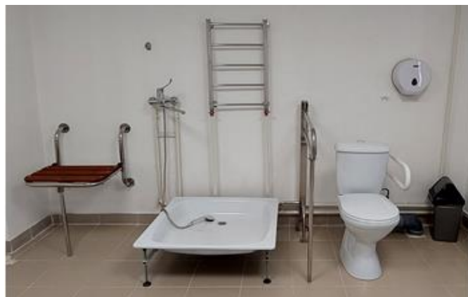
В душевых для инвалидов не смонтированы вторые унитазы, вместо трапов установлены душевые поддоны

- в душевых для инвалидов (помещение 34 и 35) не смонтированы предусмотренные сметой № 02-01-03 и оплаченные по акту ф. КС-2 от 20.06.2023 дополнительные унитазы «Комфорт», травмобезопасные крючки для костылей, душевые штанги, ограничитель температуры, автоматический воздухоотводчик. Также отсутствуют трапы канализационные (специальная система с сифоном, монтируемая в полу для сбора стоков и направления их в канализацию), при этом по акту ф. КС-2 от 20.06.2023 работы по их установке, включая стоимость трапов, подрядчиком предъявлены, а заказчиком (администрация Жигаловского района) приняты и оплачены (п/п от 07.07.2023). Вместо указанных трапов подрядчиком установлены душевые поддоны, что не позволит их использовать маломобильным гражданам, для которых они устанавливались;