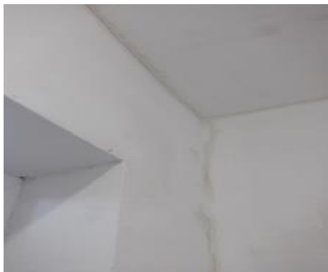
Непрокрасы стен и потолков

- акриловая и водоэмульсионная окраска стен и потолков в помещениях ФОК выполнена с большим количеством непрокрасов и пропусков, подтеков, с окраской выключателей и электропроводки, что не соответствует обязательным требованиям табл. 7.7 СП 71.13330.2017 «Изоляционные и отделочные покрытия». Информация о некачественно выполненных работах представлена в приложении 4 к настоящему отчету.