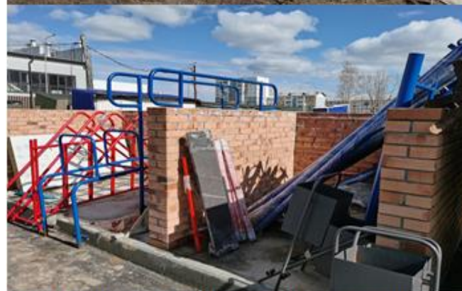
Не смонтированное спортивное ядро