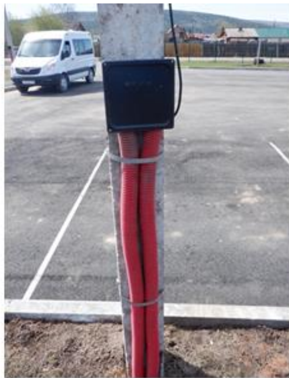
Электрокабель уличного освещения проложен не в металлических трубах

Во время двух осмотров ФОК р.п. Жигалово (первый проведен КСП в период с 9 по 12 апреля 2024 года, второй проведен КСП с привлечением экспертов АНО «Байкальский центр судебных экспертиз, права и землеустройства» 14 мая 2024 года), проведенных с участием представителей администрации Жигаловского района и МКУ