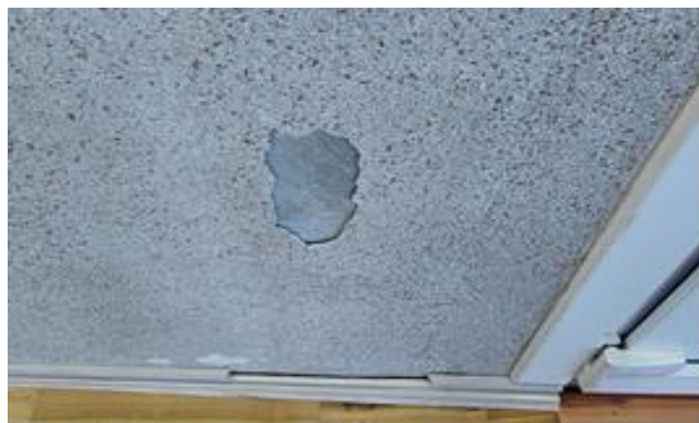
Декоративная штукатурка «Флок» отслаивается от стены

- декоративная штукатурка «Флок» в спортзале и коридоре ФОК имеет следы множественных вздутий, отслоений и нарушения адгезии (сцепления) с основанием, что не соответствует требованиям табл. 27 СП 71.13330.2017 «Изоляционные и отделочные покрытия» и указывает на нарушение технологии при выполнении таких работ;