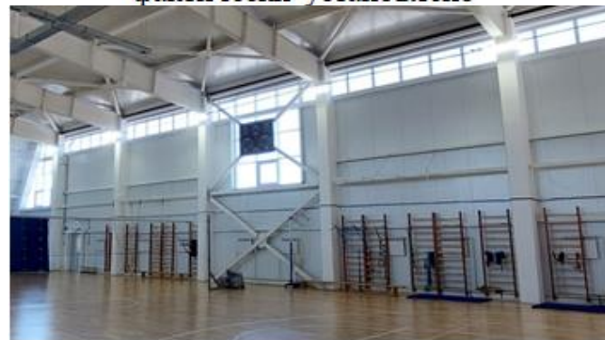
стеновой протектор отсутствует