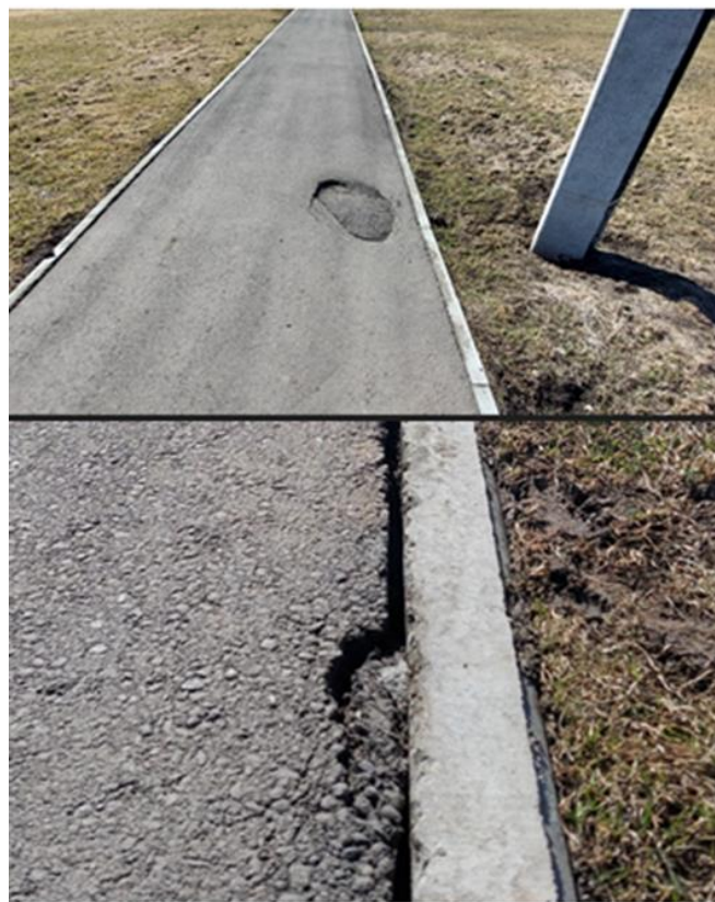
Дефекты асфальтобетонного покрытия тротуарной дорожки

Закупка оборудования в рамках контракта на строительство ФОК д. Карлук, которое технологически и функционально не связано с работами по строительству объекта, неэффективна и приводит к неоправданному повышению бюджетных расходов. Так, администрацией Карлукского МО в цену контракта от 03.06.2020 включено 27 ед. немонтируемого спортивного оборудования и инвентаря (4 каната для лазания, ворота для мини футбола, ганбола, 18 медицинболлов, бревно гимнастическое, тренировочное, передвижной мачтовый подъемник, 2 велотренажера «спин-байк») на общую сумму 888