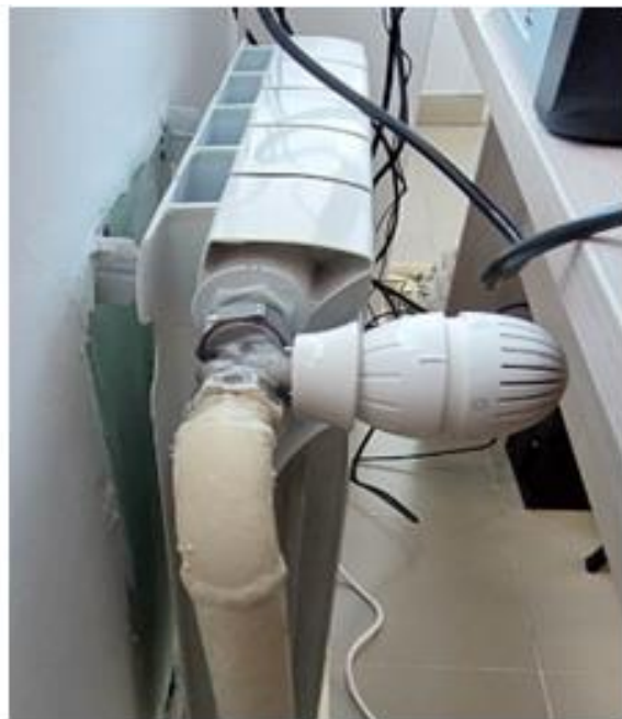
Стены за радиаторами в тренерской не оштукатурены и не окрашены