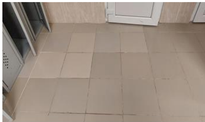
некачественно выполненные работы по устройству керамической плитки

- керамическая плитка в раздевалках и душевых физкультурно-оздоровительного комплекса уложена неровно (не по уровню), с уступами между смежными плитками, с широкими неаккуратно затертыми межплиточными