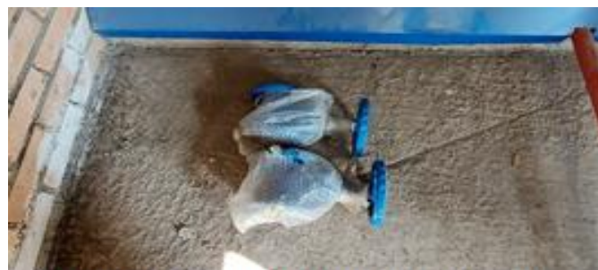
2 задвижки не смонтированы, хранятся в насосной пожаротушения