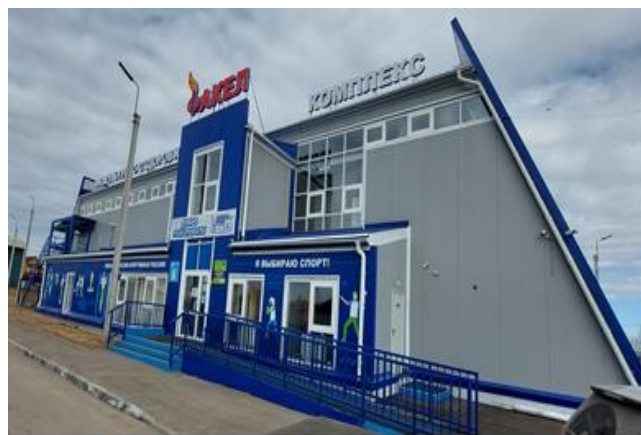
Физкультурно-оздоровительный комплекс по адресу: Иркутская область, Иркутский район, д. Карлук, ул. Луговая, 2 «А»

2.2.1. ФОК представляет собой двухэтажное здание (1 420,3 м 2 ) на металлическом каркасе и стенами из стеновых сэндвич-панелей пропускной способностью 25 человек в смену. В здании предусмотрены: спортивный зал, тренерские, медицинский кабинет; раздевалки с душевой и санузлом; раздевалки для маломобильных граждан с душевой, гардеробная, 3 санузла (из них один для маломобильных граждан), служебные помещения; зал индивидуальной силовой подготовки. На территории земельного участка ФОК расположены футбольное поле с игровыми зонами площадью 4 606 м 2 , трибуны на 288 мест, ограждение территории по периметру, 5 емкостей-резервуаров наружного пожаротушения (75 м 3 каждая), емкость ливневой канализации (30 м 3 ), выполнены работы по благоустройству (озеленение, устройство дорожного покрытия проездов, тротуаров и площадок; размещение малых архитектурных форм; устройство наружного освещения).