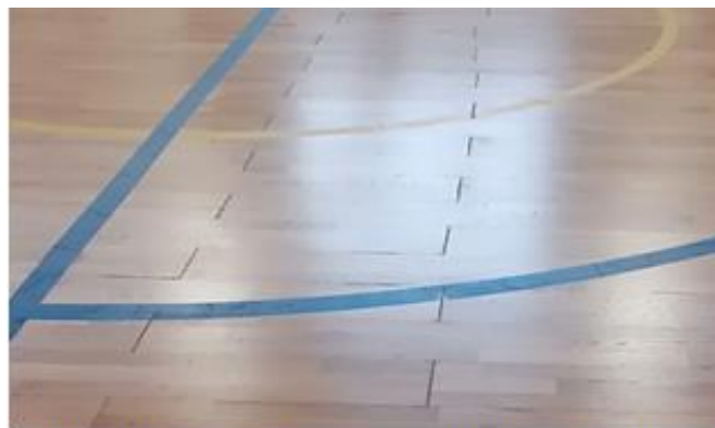
В спортивном зале некачественно уложен паркет, между паркетными досками имеются щели до 0,4 см