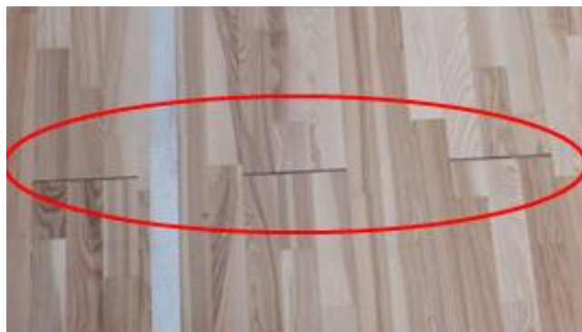
Из-за сломанных замковых соединений, доски паркета расходятся

- в отдельных местах замковые соединения спортивного паркета, уложенного в спортивном зале, сломаны, в результате доски спортивного паркета расходятся, что указывает на некачественно подготовленное основание для укладки спортивного паркета. Также в местах примыкания паркета к стене наблюдаются неровные срезы паркета и большие зазоры;