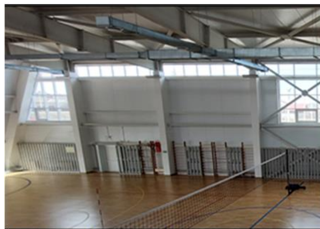
Не выполнена отделка металлических конструкций и стен навесными стеновыми протекторами

К примеру, осмотром установлено (акт осмотра от 18.04.2024), что не выполнена отделка металлических конструкций и стен навесными стеновыми протекторами ЭКОНОМ в объеме 240 м 2 (527,4 тыс. р.), предусмотренная локальным сметным расчетом 02-01-02 «Архитектурные решения» (поз. 160-161), принятая по акту о приемке