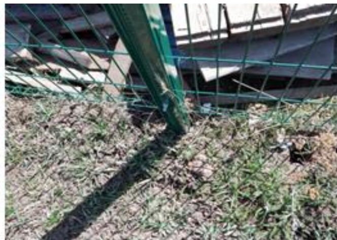
некачественно выполненные работы по установке ограждения «ГАРДИС»